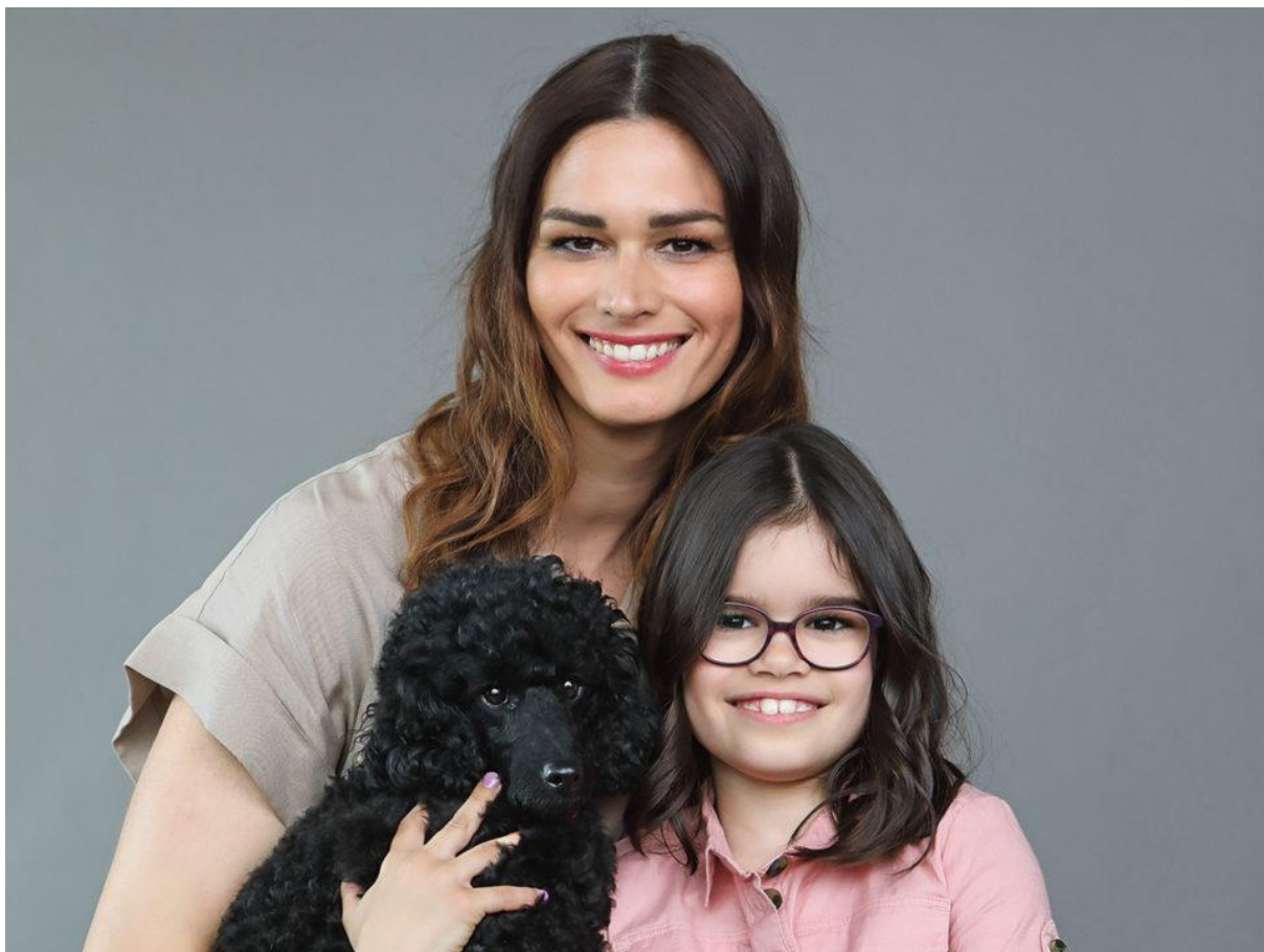
Flóra és Sámson kutyus elválaszthatatlanok